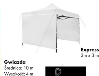
Gwiazda Średnica: 10 m Wysokość: 4 m